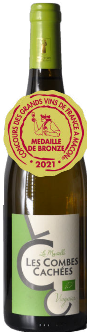
Viognier 2020 La Martelle