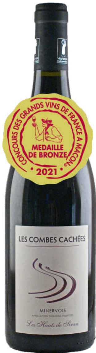
Minervois Rouge 2020 Les Hauts de Siran