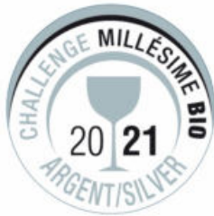
Minervois – Cru La Livinière 2018 Soleil Rouge