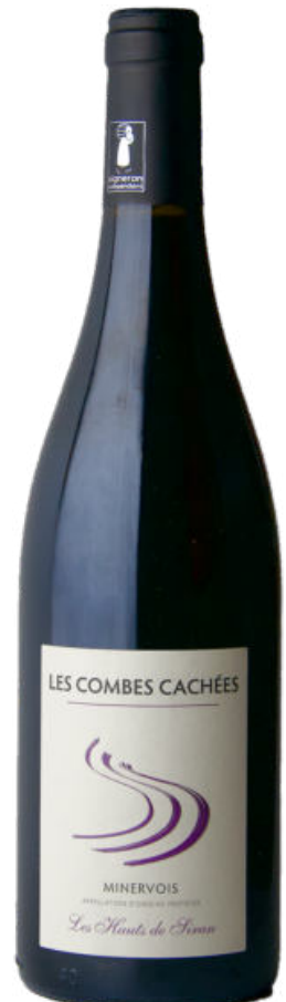
89/100 Minervois Rouge 2018 Les Hauts de Siran