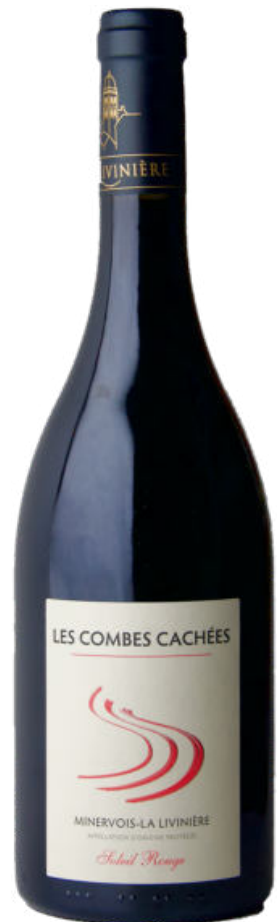
Minervois La Livinière 2017 Soleil Rouge