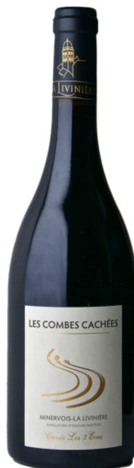
Minervois La Livinière 2017 Les Trois Écus