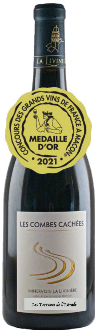
Minervois La Livinière 2018